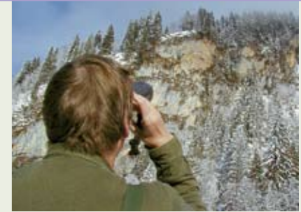
Beobachtung von Steinadlerhorsten

Bitte helfen Sie uns mit Ihrer Spende, damit wir uns weiter für den König der Lüfte einsetzen können!