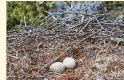
Ein aufgegebener Horst – die Brut ist verloren