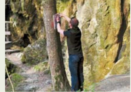
Anbringung von Hinweistafeln für Wanderer