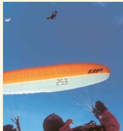
helfen wir, zu minimieren.