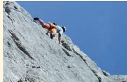
Kletterer oder durch Gleitschirmflieger