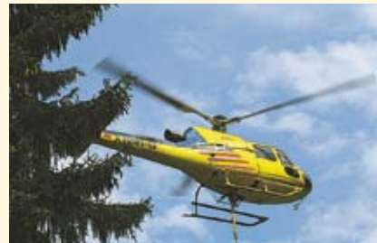
Störungen wie durch Hubschrauber,